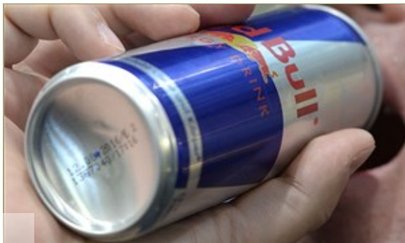
Red Bull bleibt, was es ist: die wertvollste Marke Österreichs.